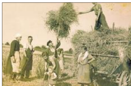
Festgehalten fürs Fotoalbum: eine Stettener Familie und ihre Zwangsarbeiterin bei der Ernte.